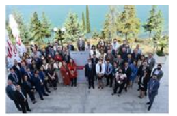
REGIONAL ANTI-CORRUPTION AND ILICIT FINANCE ROADMAP RECEPTION REPORT FOR ALBANIA