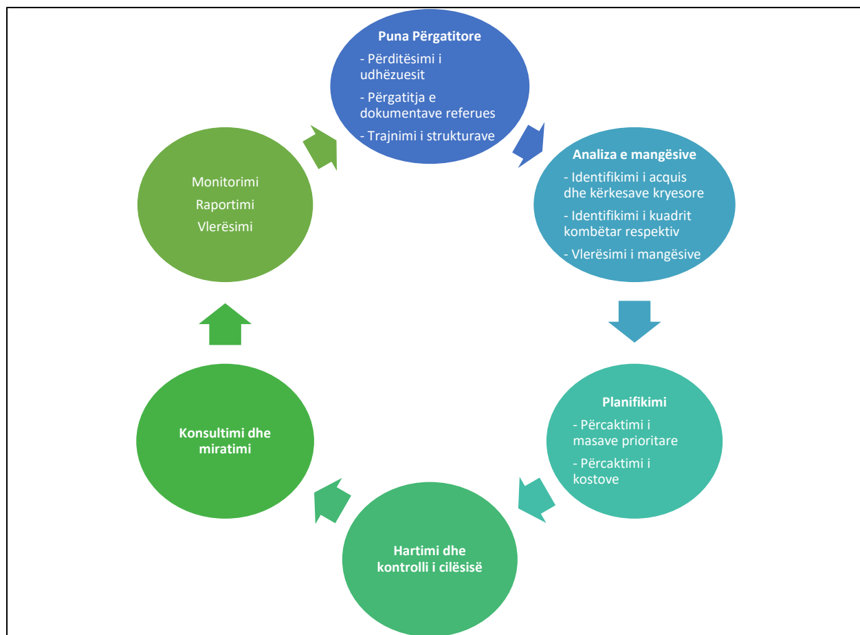
Figura: Lidhja mes proceseve të Planit Kombëtar për Integrimin Evropian

Veçanërisht të rëndësishme në këtë cikël planifikimi dhe monitorimi janë fazat e analizës së mangësive dhe planifikimit. Rezultati i këtyre proceseve mishërohet në dokumentin e Planit Kombëtar për Integrimin Evropian, i cili tregon prioritetet e përafrimit të legjislacionit, ministrinë përgjegjëse për hartimin e projektakteve, shkallën e përafrimit, si dhe datën e pritshme (paraprake) të miratimit.